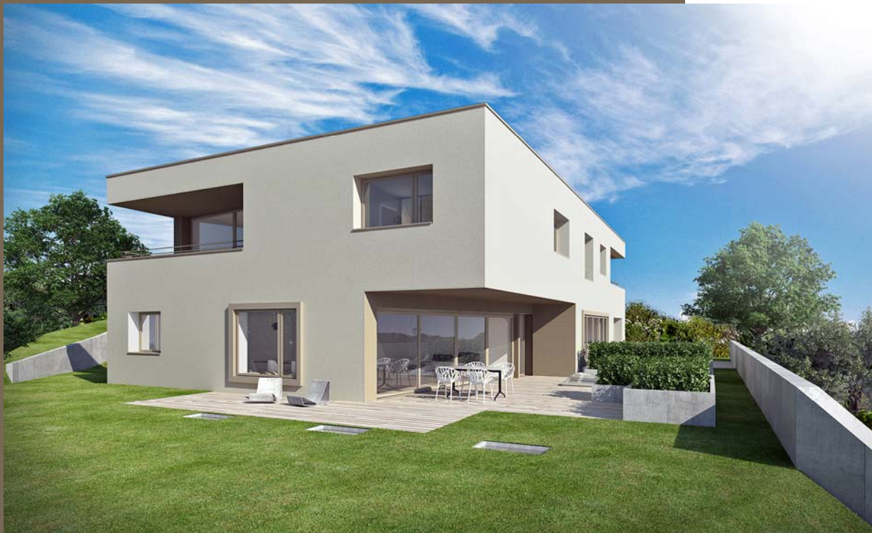
Doppeleinfamilienhaus mit Privatsphäre an aussichtsreicher Lage 5606 Dintikon